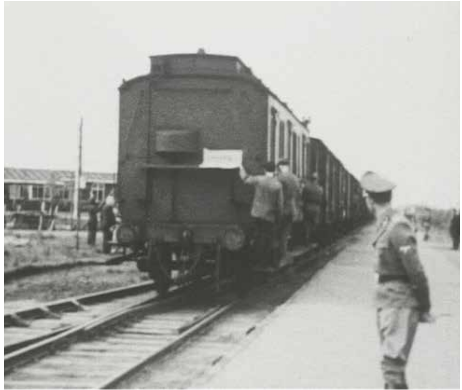
Harun Farocki. "Respiro" (Aufschub) 2007.

las intenciones del creador de este llamativo logotipo, para los espectadores de Respiro , el diseño remite a las altas chimeneas de las instalaciones de cremación de Birkenau. Tomando este proceso como fuente de inspiración, Harun Farocki optó por colocar las secuencias pacíficas de Westerbork como resonancias de otras escenas e imágenes trágicas que pueblan la memoria y la imaginación colectiva. Sobre las escenas inocuas de una clínica dental, evoca los dientes de oro arrancados a los muertos en Birkenau; sobre los delantales blancos en un laboratorio, los experimentos médicos siniestros practicados en Auschwitz; sobre los cables expuestos en un taller, los montones de pelos de mujer encontrados por los soviéticos; sobre las imágenes de obreros descansando en el pasto, las fosas abiertas y los tendales de cadáveres filmados por los Aliados cuando abrieron los campos. En Imágenes del mundo y epítafios de la guerra (1989), Farocki yuxtapone fotografías de diversas fuentes con el objetivo de descifrar los rastros de acontecimientos inscritos en las imágenes, al mismo tiempo que infiere aquello que no está representado directamente. En Respiro , sin embargo, parte de una sola fuente para evocar imágenes de la memoria. En