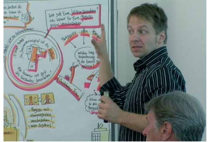
Harun Farocki. "Un nuevo producto" (Ein neues Produkt), 2012.