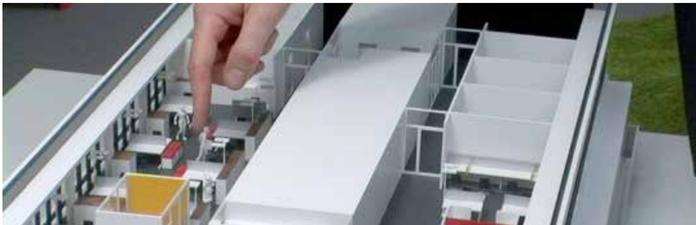
Harun Farocki. "Un nuevo producto" (Ein neues Produkt), 2012.