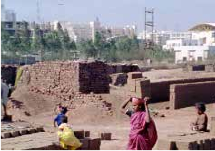
Harun Farocki. "En Comparación" (Zum Vergleich), 2009.