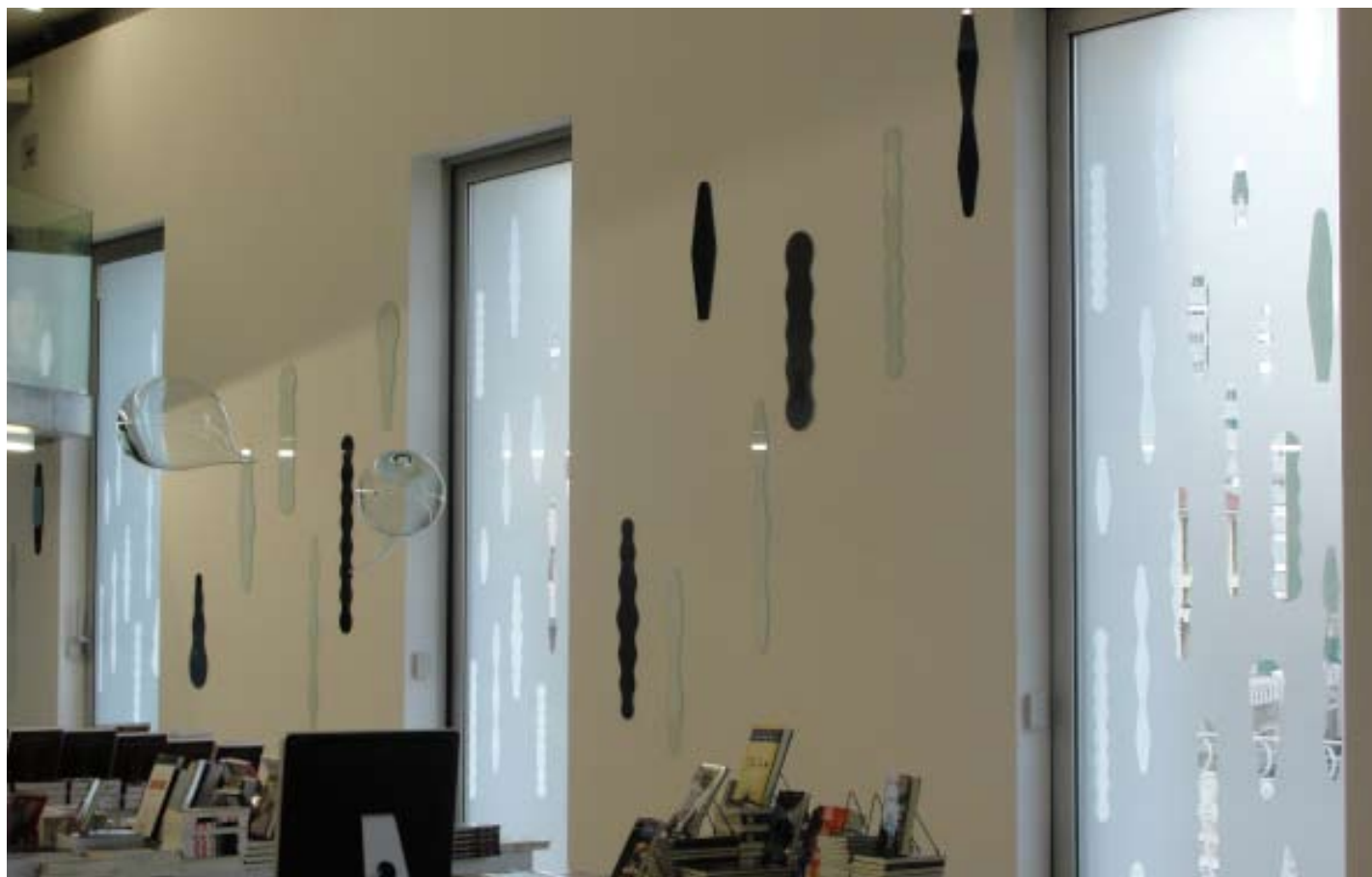
Lucio Dorr. Sin título, 2010. Intervenciones de la serie (polara). Vidrio ploteado, calado y piezas de vidrios. Medidas variables

www.luciodorr.com.ar www.galeriabm.com/spanish/novedades/061020rojas.aspx es.artaaldia.com/International/Contenidos/Resenas/Pablo_Siquier_Beto_de_Volder_and_Lucio_Dorr www.ellitoral.com/index.php/diarios/2009/03/07/culturadiario/CULT-01.html www.malevoestampa.com.ar/index.php/projects/lucio-dorr www.lanacion.com.ar/nota.asp?nota_id=190382