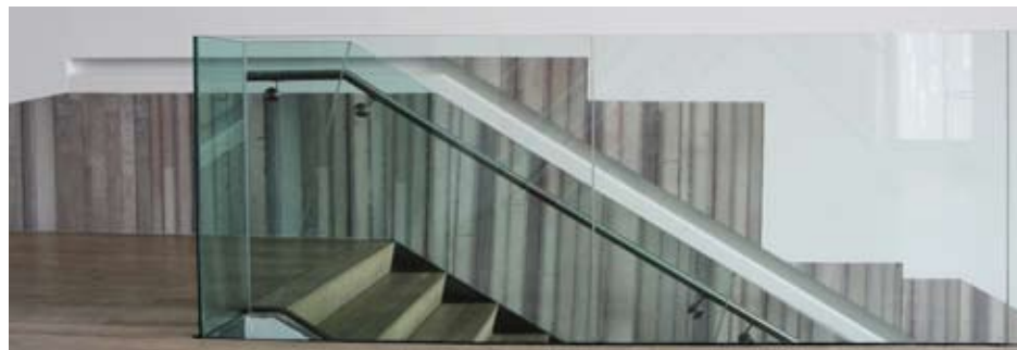
Marcolina Dipierro. Sin título, 2010. Intervención en sitio específico. Medidas variables

Estos conceptos descriptos sumados a la historia como memoria están presente en RAM : el azar, lo aleatorio, el movimiento como parte de un presente en permanente cambio.