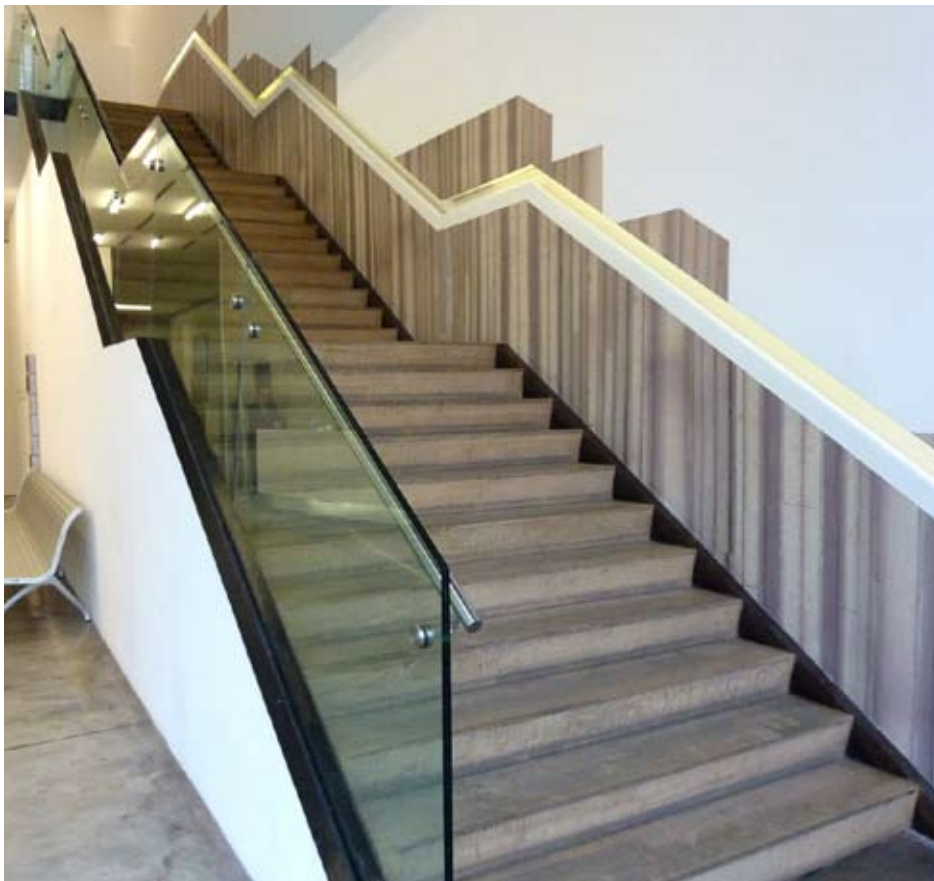
Marcolina Dipierro. Sin título , 2010. Intervención en sitio específico. Medidas variables

momento cualquier tipo de intervención lumínica como las que venía realizando anteriormente ya que estas necesitaban de oscuridad total.