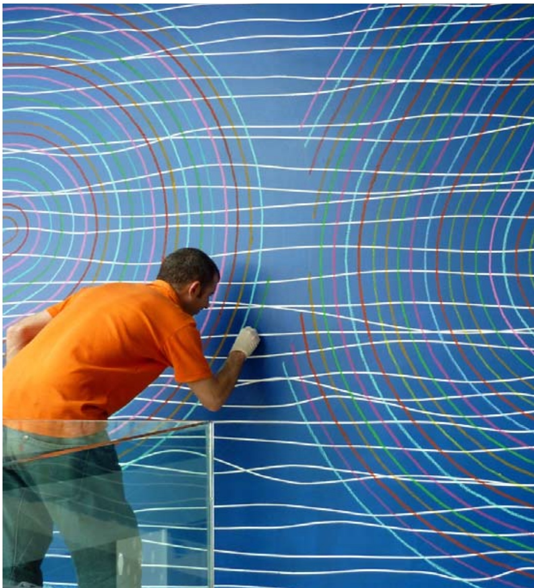
Mariano Ferrante. Construcción dinámica N° 4/10 , 2010. Acrílico y óleo pastel sobre pared. 115 x 300 cm.

Departamento de Prensa [+54-11] 4104 1044 prensa@proa.org www.proa.org